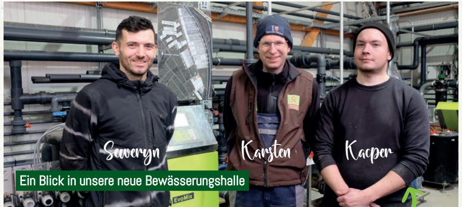
Ein Blick in unsere neue Bewässerungshalle

Wasser ist die Grundlage für alles, was auf unseren Feldern wächst. Genau deshalb gehen wir damit besonders sorgfältig um.